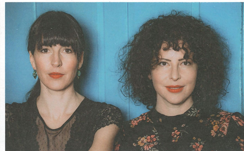
Auch die ladinische Band „Ganes“ gastiert in Toblach

Abend. Am 21. Februar wird beim jährlichen Improtheater wieder viel gelacht und spontan inszeniert. Eine besondere Neuerung im Jahr 2026 ist die zeitliche Verlegung des „Festivals Dolomites“. Nach fünfzehn Jahren erfolgreicher Präsentation hochkarätiger musikalischer Ereignisse im Sommer findet das Festival heuer bereits im März statt. Unter dem Titel „GlücksGriffe“ verbindet das Programm sinfonische Werke mit Jazzkonzerten und Literatur und bietet damit ein facettenreiches Musikerlebnis für ein breites Publikum. Weiter geht der musikalische Frühling mit der Pustertaler Gruppierung „Auläng“ am 29. März sowie mit dem Kinderkonzert „Mission Planet B“ am 9. Mai. Ein besonderes Highlight erwartet Sie am 17. Mai. Die ladinische Band „Ganes“ gastiert in Toblach und verspricht